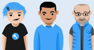
Ante tres testigos

(mayores de edad, al menos dos sin parentesco hasta 2º grado, ni vinculados por matrimonio o patrimonio)